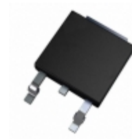
AN7710SP Panasonic IC REG LDO 10V 1.2A SP3SUA