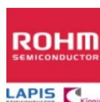
BA17810FP LAPIS Semiconductor BA17810FP ROHM