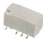
TX2SA-3V-X Panasonic Electric Works RELAY TELECOM DPDT 2A 3V