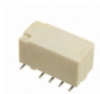
TX2SA-4.5-TH Panasonic Electric Works RELAY GEN PURPOSE DPDT 2A 4.5V