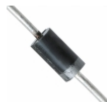
UF4003-AP Micro Commercial Components (MCC) DIODE GPP ULT FAST 1A DO-41