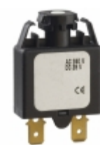
1658-F01-00-P10-10A E-T-A CIR BRKR THRM 10A 240VAC 28VDC