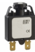
1658-F01-00-P10-15A E-T-A CIR BRKR THRM 15A 240VAC 28VDC