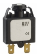
1658-F01-00-P10-20A E-T-A CIR BRKR THRM 20A 240VAC 28VDC