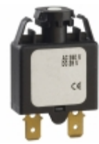
1658-F01-00-P10-25A E-T-A CIR BRKR THRM 25A 240VAC 28VDC