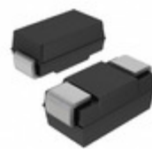
PTZTE258.2B LeCroy (Teledyne LeCroy) DIODE ZENER 8.7V 1W PMDS