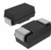
PTZTE259.1A LAPIS Semiconductor DIODE ZENER 9.1V 1W PMDS