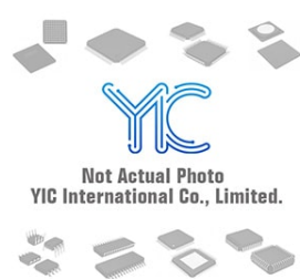
MIC29500-3.3WU MICREL MICREL TO-263