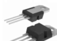
MIC29500-5.0BT Microchip Technology IC REG LDO 5V 5A TO220-3