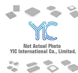
MIC29500-2.5WT Micrel Micrel TO-220