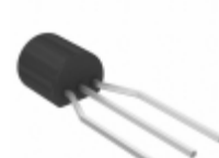
MIC2950-06YZ TR Microchip Technology IC REG LDO 5V 0.15A TO92-3