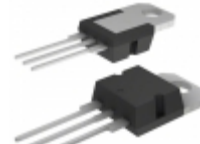
MIC29500-3.3BT Microchip Technology IC REG LDO 3.3V 5A TO220-3