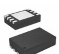
MCP6V72T-E/MNY Microchip Technology IC OP AMP ZERO DRIFT DUAL 8TDFN