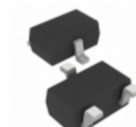
MCP131T-240E/LB Microchip Technology IC SUPERVISOR 2.32V LOW SC-70