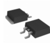
ACST1235-7G STMicroelectronics TRIAC 700V 12A D2PAK