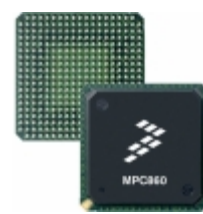
MC68MH360ZQ25L NXP USA Inc. IC MPU M683XX 25MHZ 357BGA