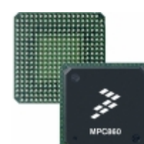
MC68MH360ZQ25LR2 NXP USA Inc. IC MPU M683XX 25MHZ 357BGA