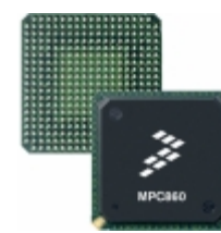
MC68MH360ZQ33LR2 NXP USA Inc. IC MPU M683XX 33MHZ 357BGA