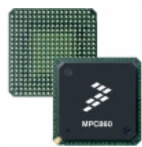
MC68MH360ZQ33L NXP USA Inc. IC MPU M683XX 33MHZ 357BGA