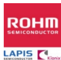
BU4933G ROHM BU4933G ROHM