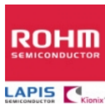
BU4932FVE ROHM BU4932FVE ROHM