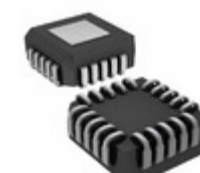
MX7548JP+T Maxim Integrated IC DAC 12BIT MPU COMP 20PLCC