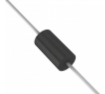
BZW06-31 STMicroelectronics TVS DIODE 30.8VWM 64.3VC DO15