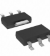
MCP1790-3002E/DB Microchip Technology IC REG LDO 3V 70MA SOT223-3