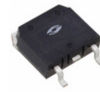
APT60S20SG/TR Microsemi Corporation DIODE SCHOTTKY 200V 75A D3PAK