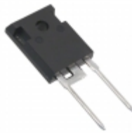
APT60S20BG Microsemi Corporation DIODE SCHOTTKY 200V 75A TO247