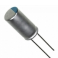
827ULR2R5MEF Illinois Capacitor CAP ALUM POLY 820UF 20% 2.5V T/H