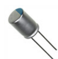
827UER2R5MFF Illinois Capacitor CAP ALUM POLY 820UF 20% 2.5V T/H