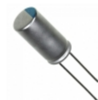
827ULR010MFH Illinois Capacitor CAP ALUM POLY 820UF 20% 10V T/H