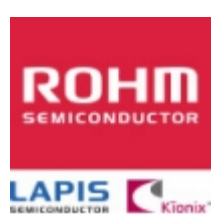
MTZJT-7233B/33V ROHM MTZJT-7233B/33V ROHM