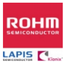
MTZJT-7230B/30V ROHM MTZJT-7230B/30V ROHM