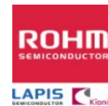
EDZVT2R13B/0402-13V ROHM EDZVT2R13B/0402-13V ROHM