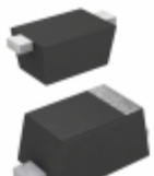
EDZVT2R18B Rohm Semiconductor DIODE ZENER 18V 150MW EMD2