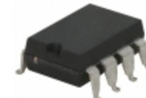
PAA110LS IXYS Integrated Circuits Division RELAY OPTOMOS 150MA DPST 8-SMD