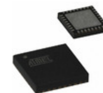
AT97SC3205T-G3M46-20 Microchip Technology FF COM I2C TPM 4X4 32VQFN SEK -