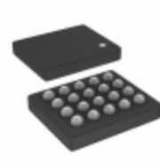
ISL99203IIZ-T Intersil IC AMP AUDIO 5.5W MONO D 20WLCSP