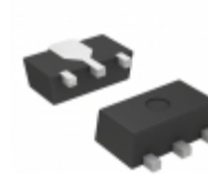
S-80824KNUAD2BT2G SII Semiconductor Corporation IC VOLT DETECTOR 2.4V SOT89-3