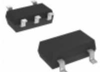
DMA2610M0R Panasonic Electronic Components TRANS PREBIAS DUAL PNP MINI5