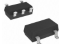
DMA261060R Panasonic Electronic Components TRANS PREBIAS DUAL PNP MINI5