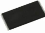
AT45CS1282-TC Microchip Technology IC FLASH 128MBIT 50MHZ 40TSOP