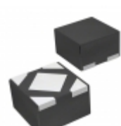
BU18JA2MNVX-CTL Rohm Semiconductor IC REG LDO 1.8V 0.2A 4SSON