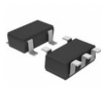
BU18SD2MG-MTR Rohm Semiconductor IC REG LDO 1.8V 0.2A 5SSOP