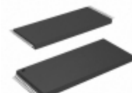
AT27LV040A-90TC Microchip Technology IC OTP 4MBIT 90NS 32TSOP