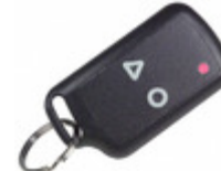
110C2-433A RF Solutions AM 433MHZ POCKET KEYFOB 2 SW, 10