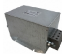
110AYC10B Agastat Relays / TE Connectivity LINE FILTER 110A CHASSIS MOUNT