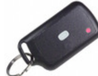
110C1-315AR2 RF Solutions TRANSMITTER AM 315MHZ 1 SWITCH