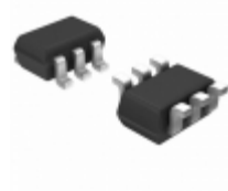
XP0553100L Panasonic Electronic Components TRANS 2NPN 10V 0.05A SMINI6