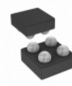
MIC94310-4YCS-TR Microchip Technology IC REG LDO 1.2V 0.2A 4WLCSP