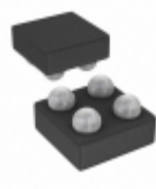
MIC94310-DYCS-TR Microchip Technology IC REG LDO 1.85V 0.2A 4WLCSP