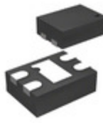
MIC94310-4YMT-T5 Microchip Technology IC REG LDO 1.2V 0.2A 4TMLF