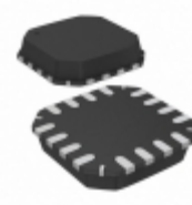
AD8295ACPZ-WP Analog Devices Inc. IC OPAMP INSTR 1MHZ 16LFCSP