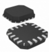
AD8295ACPZ-R7 Analog Devices Inc. IC OPAMP INSTR 1MHZ 16LFCSP