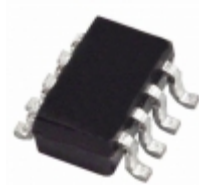
AD8293G80BRJZ-R7 Analog Devices Inc. IC OPAMP INSTR 500HZ RRO SOT23-8