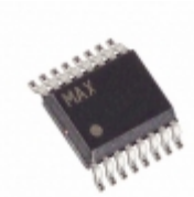
MAX6639AEE+ Maxim Integrated IC TEMP MONITOR 2CH 16-QSOP