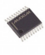
MAX6636UP9A+ Maxim Integrated SENSOR TEMPERATURE SMBUS 20TSSOP