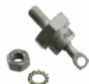
DSI75-12B IXYS DIODE GEN PURP 1.2KV 110A DO203