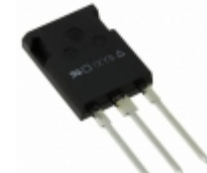
DSI45-16AR IXYS DIODE GEN 1.6KV 48A ISOPLUS247