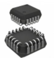
MC10H159FNR2G ON Semiconductor IC MUX QUAD 2IN INVERT 20PLCC