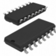
MC10H159MELG ON Semiconductor IC MUX QUAD 2INP INV 16SOEIAJ