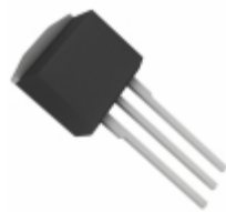
ON5230,127 NXP USA Inc. MOSFET RF SOT226 I2PAK