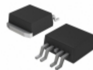
ON5213,118 NXP USA Inc. MOSFET RF SOT426 D2PAK