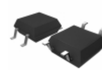
BU4828F-TR Rohm Semiconductor IC VOLT DETECTOR 2.8V SOP4