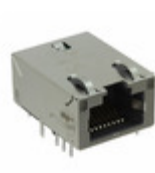
A829-1J1T-KM Bel MAGJACK 1P 1GBT AUTO ETHERNET