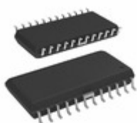
A8287SLBTR Allegro MicroSystems, LLC IC REG LNB SUPPLY/CTRL 24SOIC