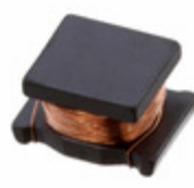
LQH32DN680K23L Murata Electronics North America FIXED IND 68UH 130MA 2.86 OHM