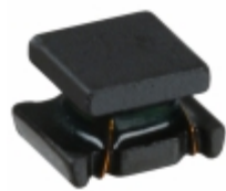
LQH32MN100J23L Murata Electronics North America FIXED IND 10UH 190MA 1.8 OHM SMD