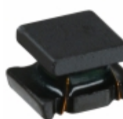
LQH32MN101J23L Murata Electronics North America FIXED IND 100UH 80MA 7 OHM SMD