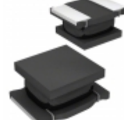
LQH32DN6R8M53L Murata Electronics North America FIXED IND 6.8UH 540MA 260 MOHM