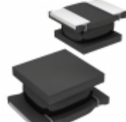
LQH32DN680K53L Murata Electronics North America FIXED IND 68UH 130MA 2.6 OHM SMD