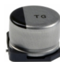
EEV-TG1V470UP Panasonic Electronic Components CAP ALUM 47UF 20% 35V SMD