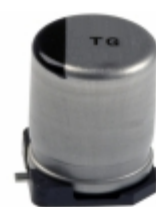
EEV-TG2A220UP Panasonic Electronic Components CAP ALUM 22UF 20% 100V SMD