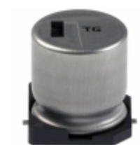
EEV-TG1V331Q Panasonic Electronic Components CAP ALUM 330UF 20% 35V SMD