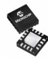
PIC16LF1574T-I/JQ Microchip Technology IC MCU 8BIT 7KB FLASH 16UQFN