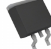
BA17820FP-E2 Rohm Semiconductor IC REG LDO 20V 1A TO252-3