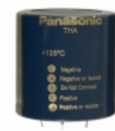
ECE-T2WA471EA Panasonic Electronic Components CAP ALUM 470UF 20% 450V SNAP