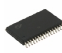
CY62148VNLL-70SXI Cypress Semiconductor Corp IC SRAM 4MBIT 70NS 32SOIC