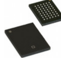
CY62156ESL-45BVXI Cypress Semiconductor Corp IC SRAM 8MBIT 45NS 48VFBGA