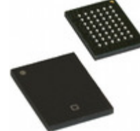
CY62156ESL-45BVXIT Cypress Semiconductor Corp IC SRAM 8MBIT 45NS 48VFBGA