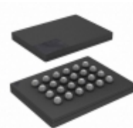
S25FL256SAGBHI313 Cypress Semiconductor IC FLASH 256M SPI 133MHZ 24BGA