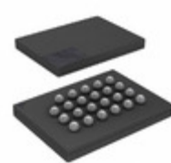
S25FL256SAGBHI200 Cypress Semiconductor Corp IC FLASH 256MBIT 133MHZ 24BGA