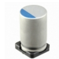
337UVR2R5MEW Illinois Capacitor CAP ALUM POLY 330UF 20% 2.5V SMD