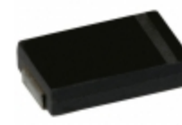
337XMPL002MG19A Illinois Capacitor CAP ALUM POLY 330UF 20% 2V SMD