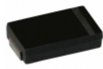
337XMPL002MG19 Illinois Capacitor CAP ALUM POLY 330UF 20% 2V SMD