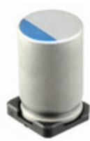
337UVG4R0MEW Illinois Capacitor CAP ALUM POLY 330UF 20% 4V SMD