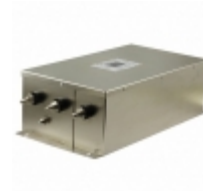
100TDS84C Delta Electronics LINE FILTER 440VAC CHASSIS MOUNT