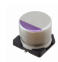
100SXV6R8M Panasonic CAP ALUM POLY 6.8UF 20% 100V SMD