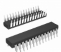
PIC16C642-20E/SP Microchip Technology IC MCU 8BIT 7KB OTP 28SDIP