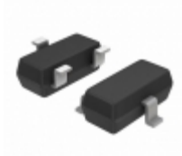
BCX19LT1G ON Semiconductor TRANS NPN 45V 0.5A SOT23