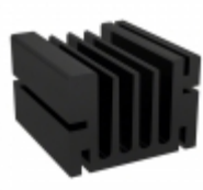
V5583E ASSMANN WSW Components HEATSINK ALUM ANOD