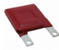
V551HF34 Littelfuse Inc. VARISTOR 863.5V 40KA SQUARE 34MM