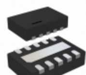
LT3970IDDB#TRMPBF Linear Technology IC REG BUCK ADJ 535MA 10DFN